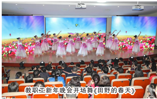
教职工新年晚会开场舞《田野的春天》

21:30,校领导孙建中、郑玉玲等在党院办、学工部、团委等相关职能部门负责人的陪同下前往药学院、基础医学院、外语学院、人文学院、信息技术学院、第一临床医学院、第二临床医学院、第三临床医学院、护理学院、康复医学院 10 个分会堂,向师生们祝贺新年,共同联欢。在各分会堂,校长郑玉玲肯定了各院系 2015 年在教学、科研和学生工作中所取得的成绩,肯定的同时也提出了更高的要求,并与师生共同欣赏各具特色的文艺节目。药学院、人文学院、基础医学院的卡通“猴”人偶或活泼可爱,或生