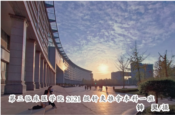
第三临床医学院 2021 级针灸推拿本科一班 钟灵/摄

遇上好友必上好酒，瓶中酒定当此醇美佳酿。酒代表洒脱，只愿就此长醉。古人优雅之士饮酒，豪放之士饮酒，粗鲁之人饮酒，富贵之人饮酒……快乐时，有酒相陪；团聚时，有酒相陪；离别时，有酒相陪……酒将喜、怒、哀、恨统统融入，一醉之下，甚是快活。好友几人围坐一桌，谈笑趣事，畅聊风声。品中药滋补之味，享烈如沉艳之意，怎能不得舒服？伊尹厨中乐，仲景药作食，中医药在医治疾病的同时，也让我们饱尝丰富的精神食粮。而我偏爱这药饮，离药于饮也自是快乐。