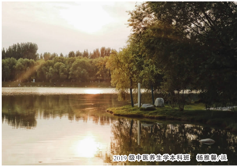
2019级中医养生学本科班 杨雅馨/摄

“吾生也有涯, 而知也无涯。”作为思想政治教育专业的一名研究生, 我深知科研之路, 婉转曲折, 布满荆棘, 但仍会以“终身学习”的态度在知识的海洋虚心潜行, 以“马克思主义”经典著作指引吸纳丰厚理论营养, 以“习近平新时代中国特色社会主义思想”作为实践遵循, 在常学常新的道路上涵养浩然之气, 塑造高尚人格。